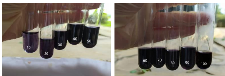
Gambar 1. Standar warna test kit yodium

Perlakuan larutan standar KIO 3 10-100 ppm dengan larutan test kit menghasilkan warna biru ungu dengan intensitas warna yang meningkat seperti ditunjukkan pada gambar 1. Selanjutnya larutan berwarna yang terbentuk ditentukan nilai RGB-nya secara pencitraan digital, nilai RGB dari masing-masing konsentrasi larutan ditunjukkan pada table 1.