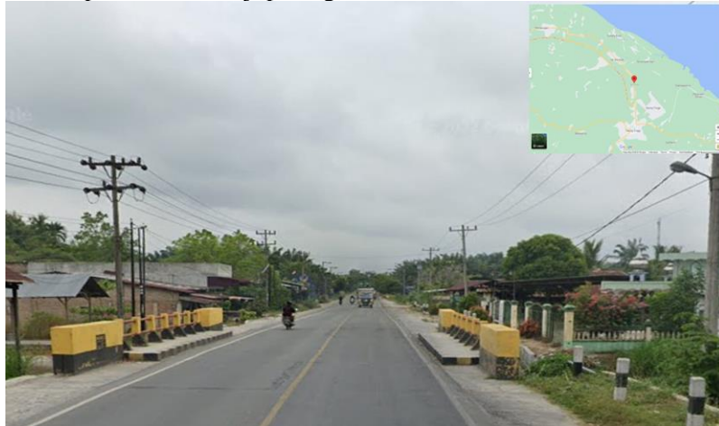
Gambar 2 Lokasi Penelitian

Adapun lokasi penelitian ini bertempat di daerah serdang bedagai yaitu Jembatan Sei Baman, Kabupaten Deli Serdang, Provinsi Sumatera Utara. Jembatan Sei Baman merupakan infrastruktur penghubung antara Kabupaten Serdang Bedagai (Sei Rampah) dengan Kota Madya (Tebing Tinggi) yang berstatus Jalan Nasional. Jembatan Sei Baman ini dilaksanakan dengan nilai proyek Rp. 3.198.402.000 (Tiga Miliar Seratus Sembilan Puluh Delapan Juta Empat Ratus Dua Ribu Rupiah) dan masa pelaksanaan 270 (Dua Ratus Tujuh Puluh) hari kalender. Dengan addendum masa pelaksanaan semula 270 (Dua Ratus Tujuh Puluh) menjadi 300 (Tiga Ratus) hari kalender. Adapun lokasi penelitian tersaji pada gambar 2.