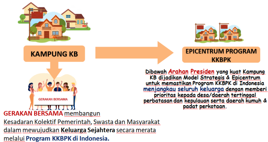
Gambar 2. Skema Utama Kampung KB

Adapun skema yang dibangun dalam pembentukan Kampung KB, digambarkan sebagai berikut: